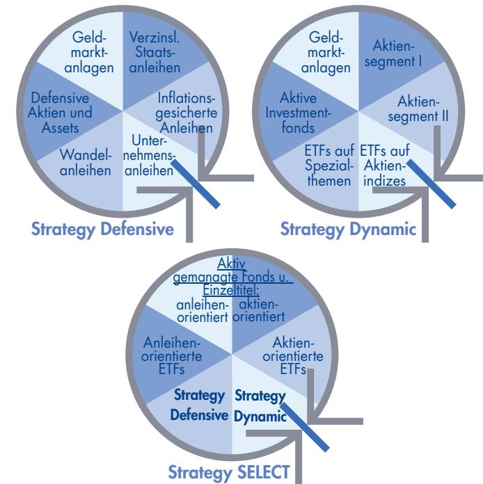
Abb.: Die Selektion von Titeln und deren Monitoring unterliegen strengen Qualitätsindikatoren. Oberste Priorität: die Qualität des Emittenten.